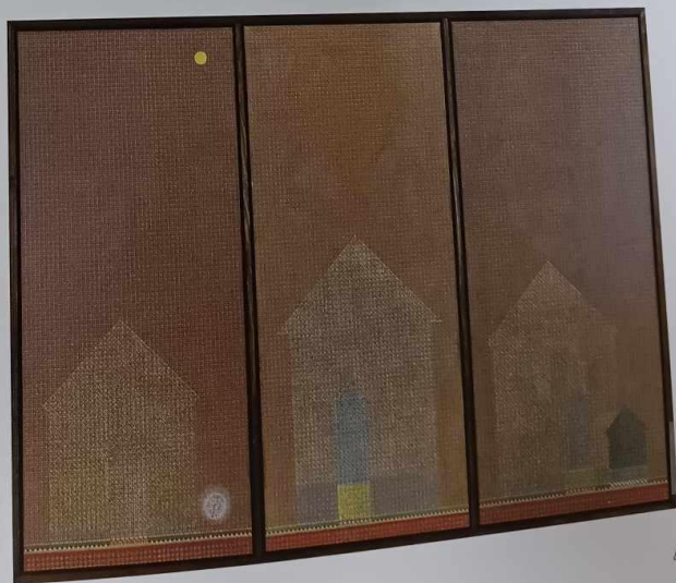
รพีพัฒน์ พชรตโปญชัย, ไตร (รูปลักษณะแห่งการยึดเหนี่ยว กาวนา), เทคนิคผสม, 145 x 190 ซม. Rapeepat Phonrattanapaiboon, Tri-Connections: Images of Bonding and Meditation, Mixed Techniques, 145 x 190 cm