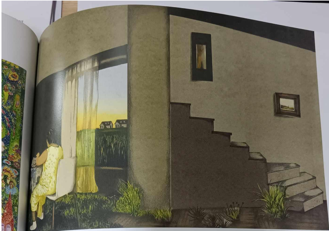
พชวีร์ เสนะประมุ, เมื่อถึงเวลา หมายเลข 2, ภาพพิมพ์ตะแกรงไหม, 60 x 90 ซม. Passawee Senaprem, When is the Time No.2, Silkscreen, 60 x 90 cm